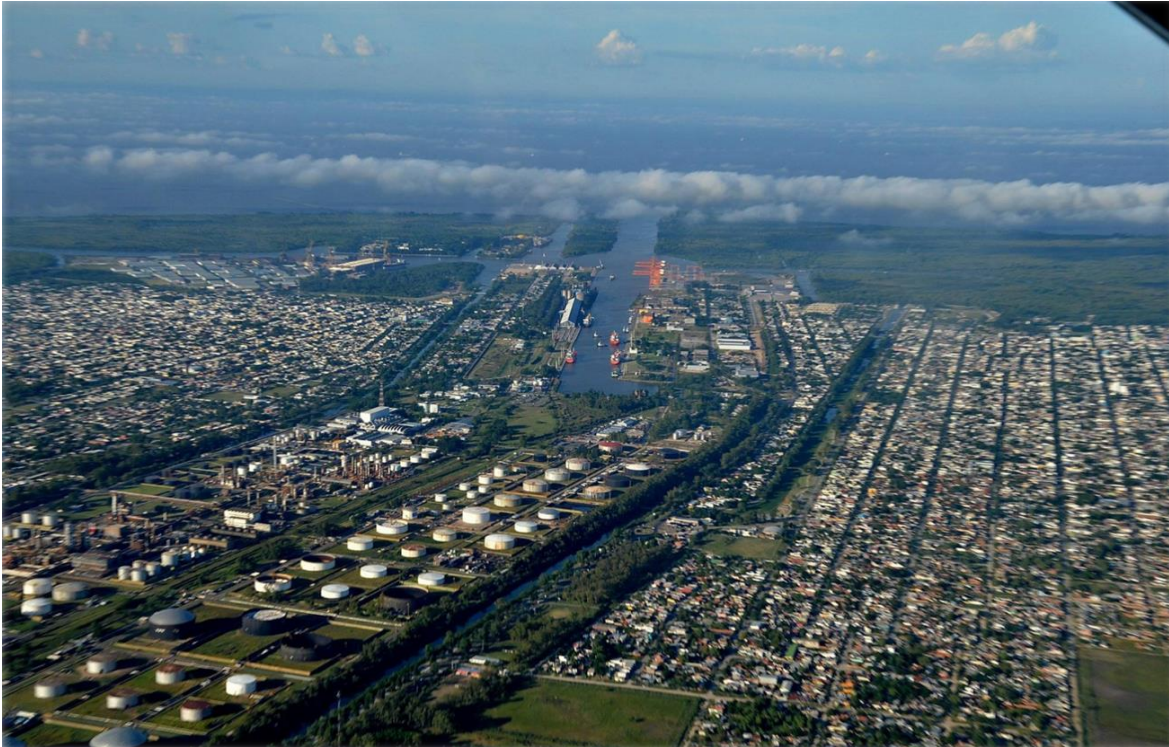
Foto aérea de la Refinería YPF-La Plata

El cambio significativo en el área se produce cuando retorna en el imaginario político la posibilidad de formar una zona industrial en las cercanías de Ensenada. Esta idea se apoya en las conocidas ventajas que otorgaba la ubicación geográfica, las vías de comunicación con el resto de la provincia y el bajo costo de la tierra en el lugar. De esta manera, en los terrenos que originariamente se iban a destinar a futuras ampliaciones del puerto La Plata, en el año 1922 se ubica la Refinería La Plata de la empresa Yacimientos Petrolíferos Fiscales (YPF).