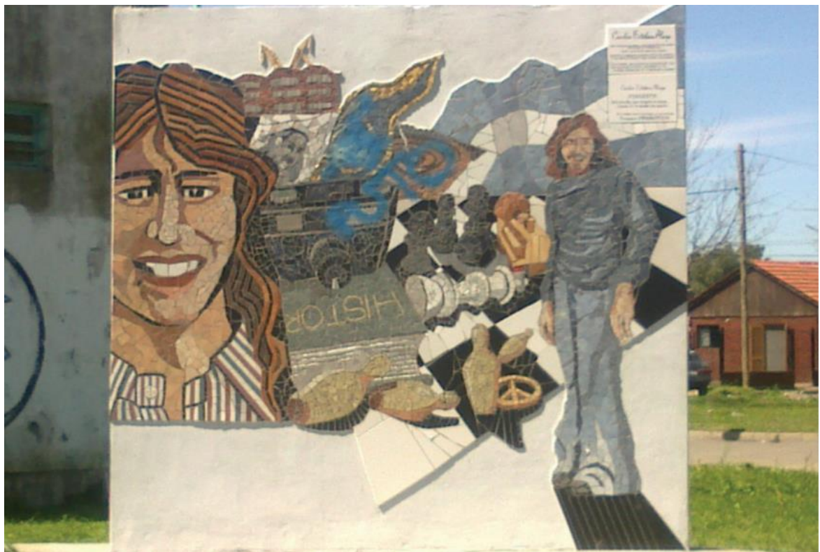
Figura 2. Mosaico Carlos Esteban Alaye, El Rancho Urutáu (2012)