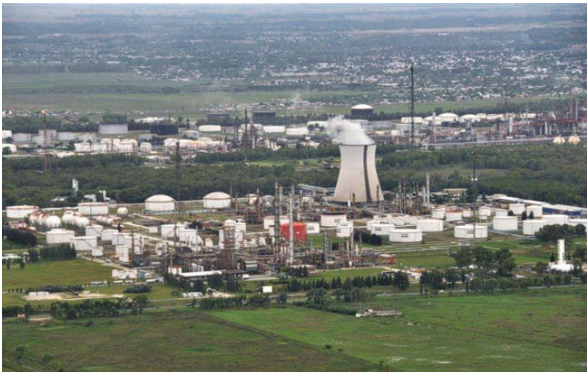
Petroquímica General Mosconi

En este conjunto de empresas es importante destacar el rol que tuvo la Petroquímica General Mosconi dado que fue de las principales inversiones del Estado nacional en la rama petroquímica con el objetivo de sustituir importaciones. Se originó en 1970 a partir de la asociación de YPF y la Dirección Nacional de Fabricaciones Militares. Inaugurada en 1974 se transformó en una de las principales empresas de la región, con importantes niveles de productividad y exportación producto de la tecnología incorporada y sus capacidades productivas. En la década de los años '80 la empresa llevó a cabo numerosas inversiones que la transformaron en la empresa industrial argentina de mayor inversión en el segundo quinquenio de la década y la de mayor capacidad productiva en la rama petroquímica, enfrentando las restricciones económicas de ese período (Odisio, 2015).