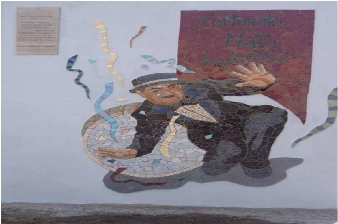
Figura 1 Mosaico "Nato" Fortunato Agustín Andreucci, El Rancho Urutáu (2011)