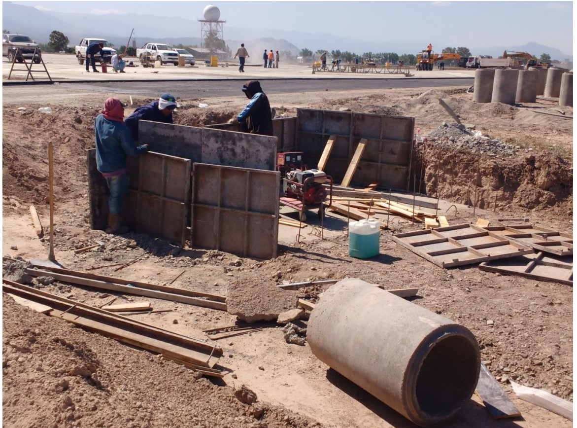
Figura N° 29: encofrado para la ejecución de cámara de inspección.

La ejecución de estas tareas se realizó entre el 10 y 15 de noviembre.