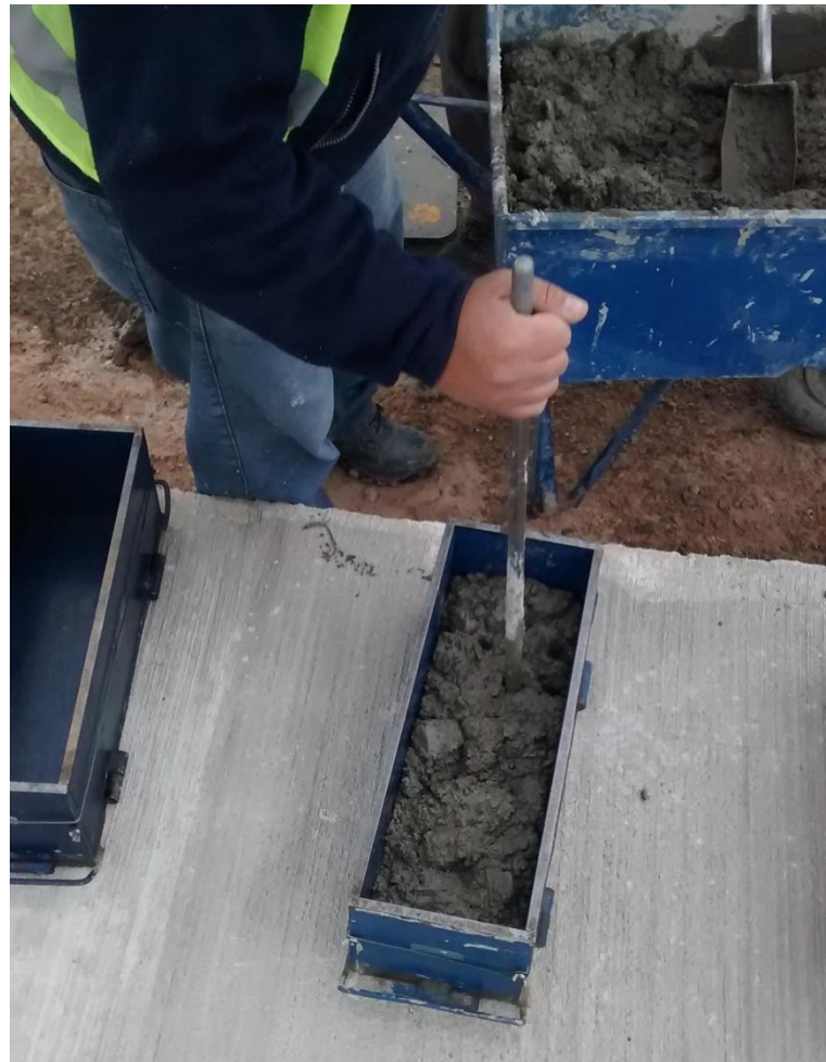
Figura N° 16: moldeo de probetas para ensayo de flexión.