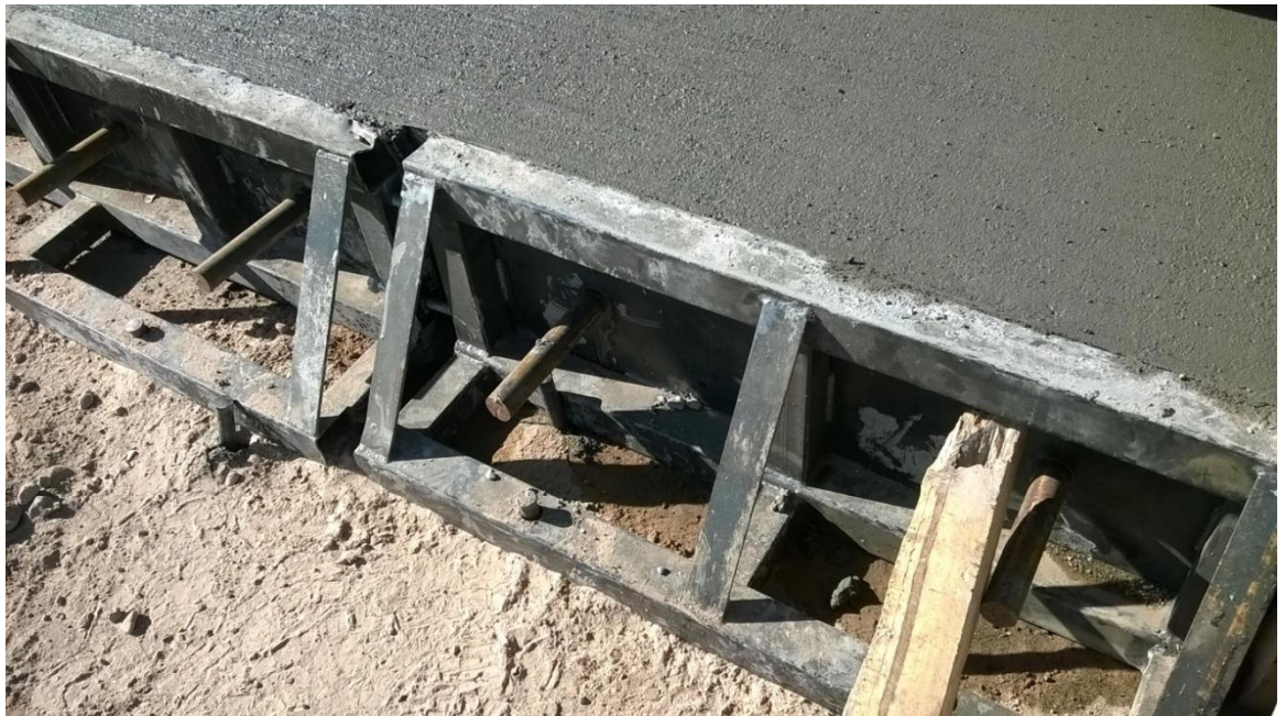
Figura N° 17: junta constructiva.