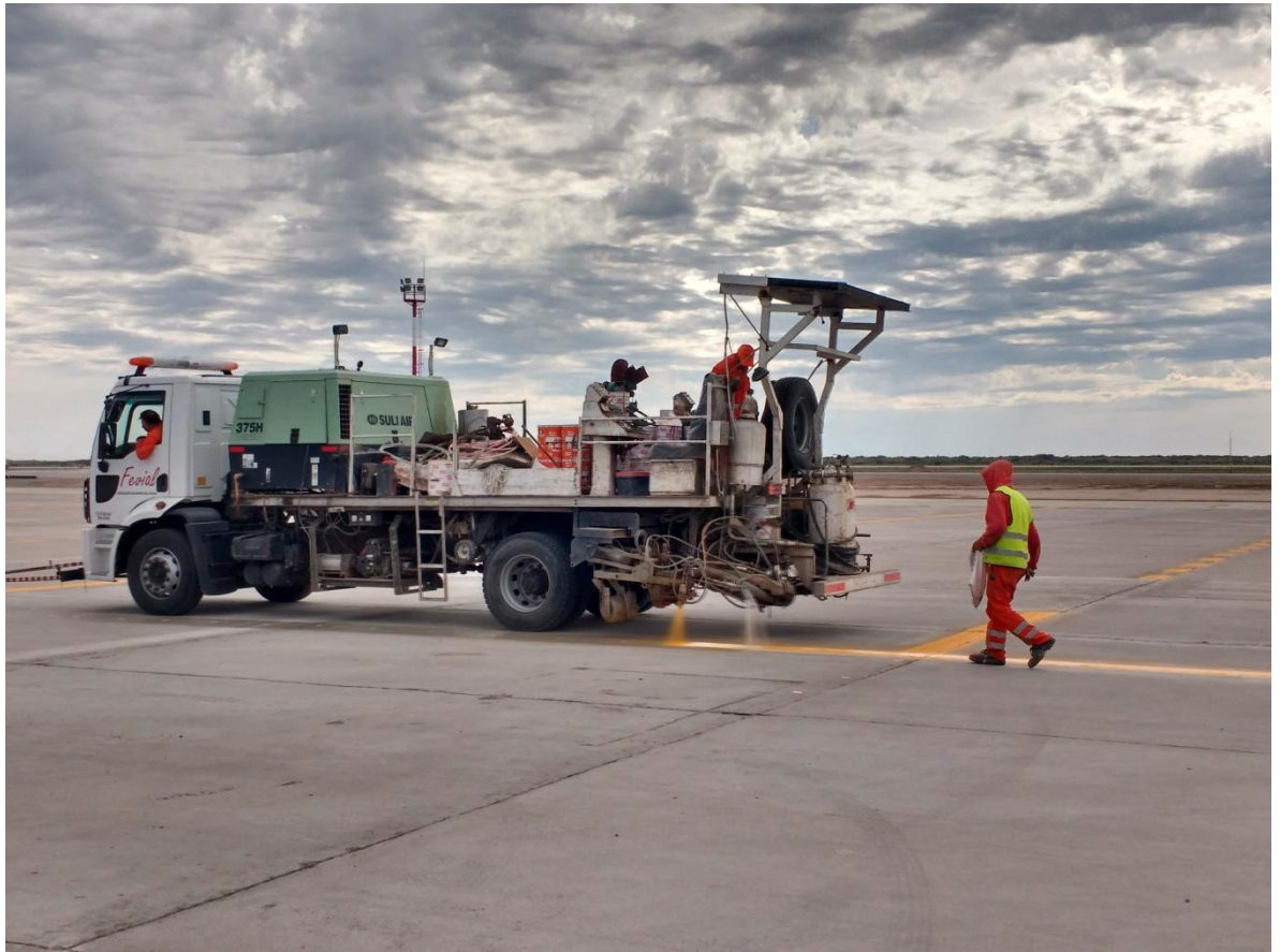
Figura N° 35: equipo para la colocación de pintura y microesferas de vidrio.