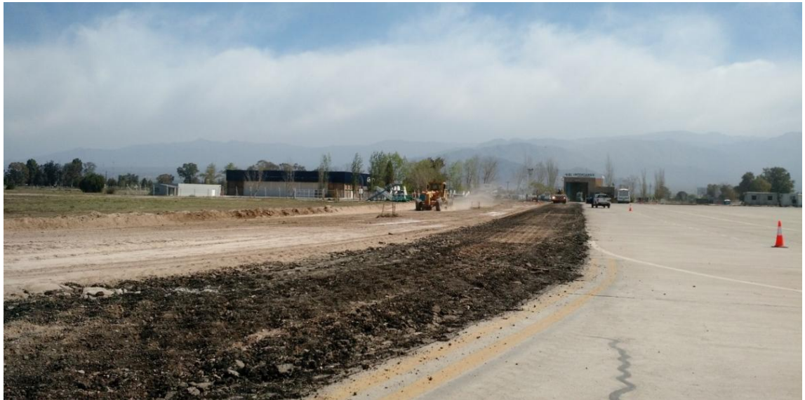
Figura N° 6: demolición de pavimento existente.

Este ítem comprende las tareas de retiro de las capas integrantes de pavimento de C°A°. Para ello se utilizó un rodillo pata de cabra para la demolición (Figura N° 6), y una cargadora y camiones para el retiro y su posterior colocación en el predio del Aeropuerto según las disposiciones de la Dirección de Obra. Estas tareas abarcaron una superficie de 3525m 2 .