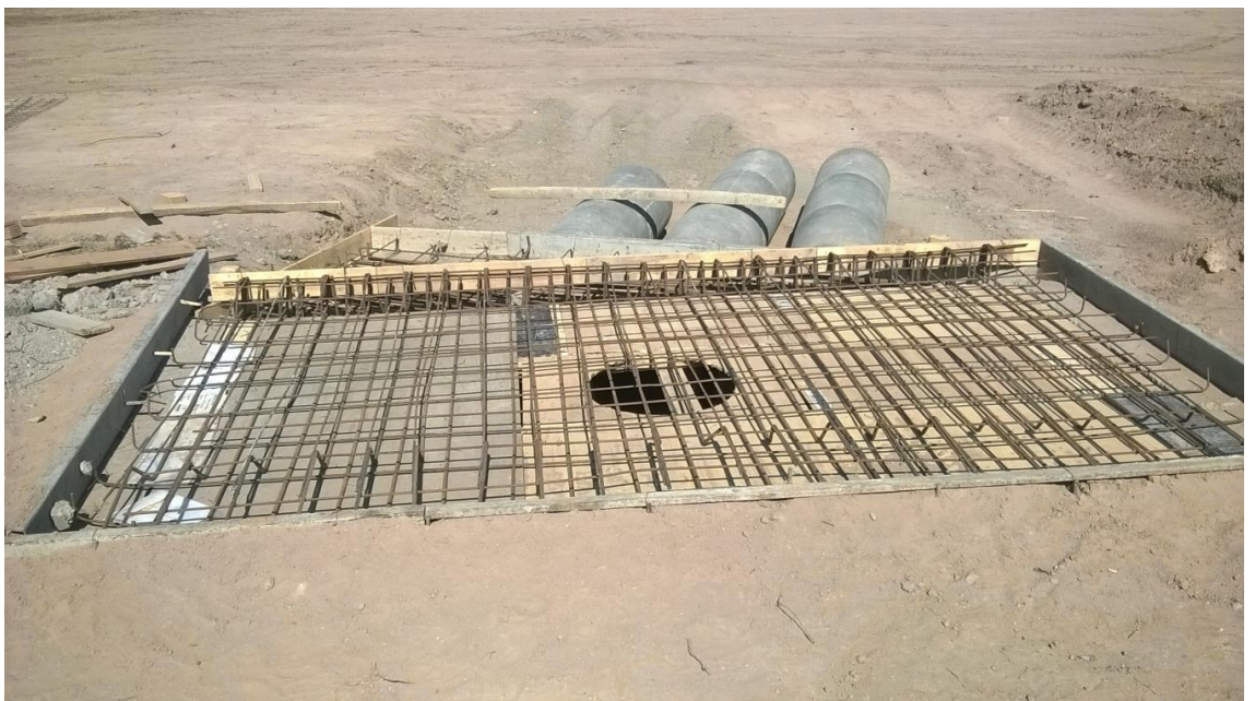
Figura N° 31: encofrado y armadura de la losa superior de la cámara de inspección.