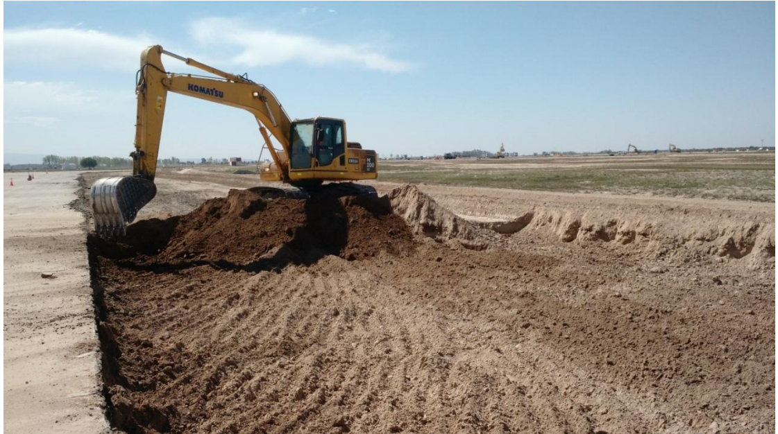
Figura N° 2: demolición y retiro de la carpeta asfáltica existente