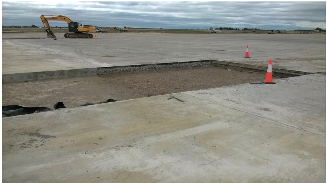
Figura N° 10: preparación del terreno para la ejecución de la losa.