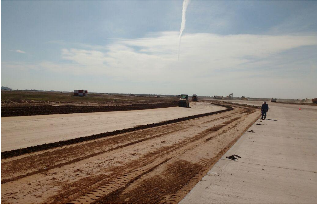
Figura N° 4: compactación de la base de asiento.