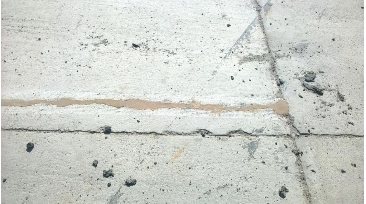
Figura N° 8: resellado de fisuras y juntas existentes.