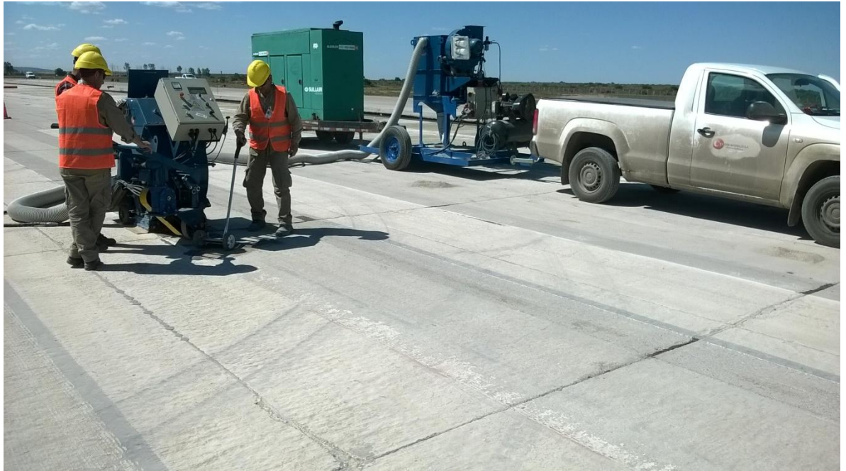
Figura N° 33: tareas para el borrado de pintura existente.