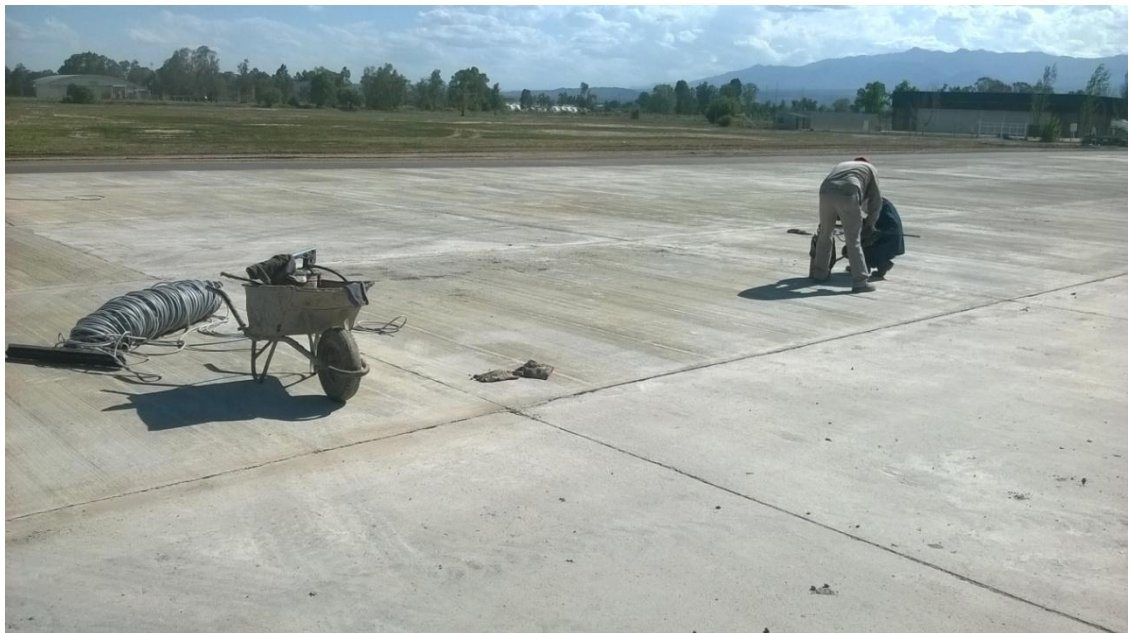
Figura N° 21: colocación de cordón de respaldo y silicona para sellado de juntas.