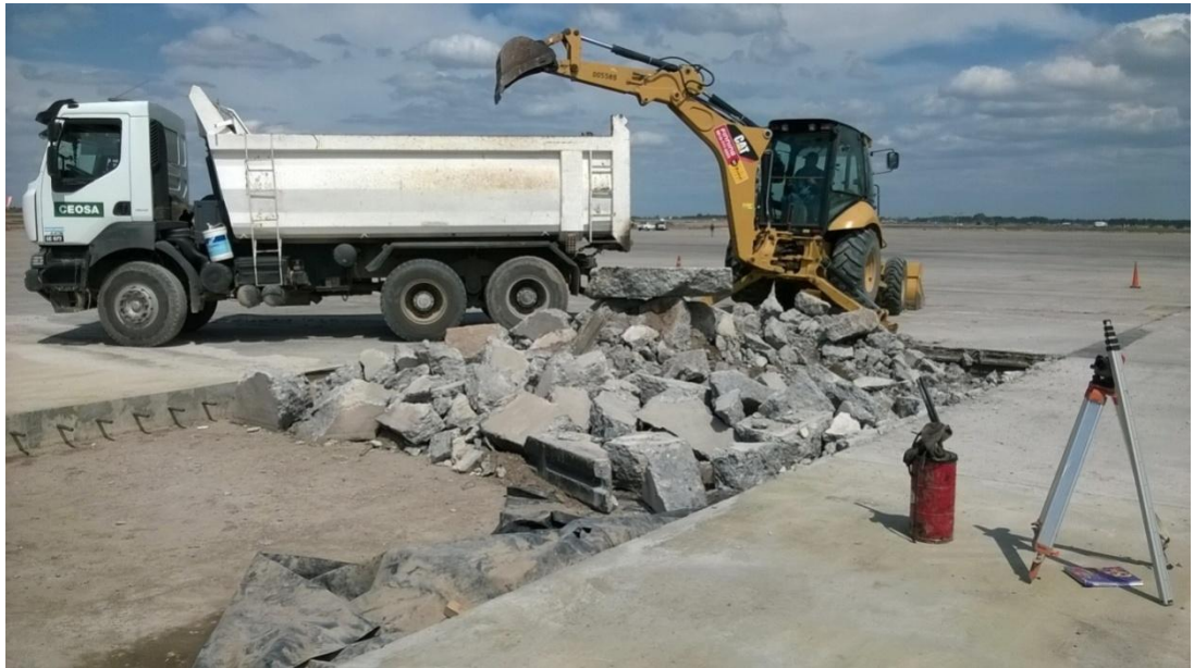
Figura N° 9: remoción de losas de hormigón con retropala.