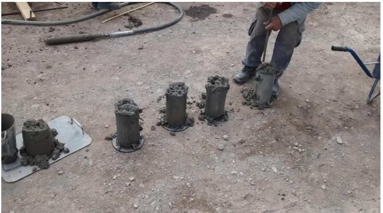
Figura N° 15: moldeo de probetas para ensayos a compresión simple.