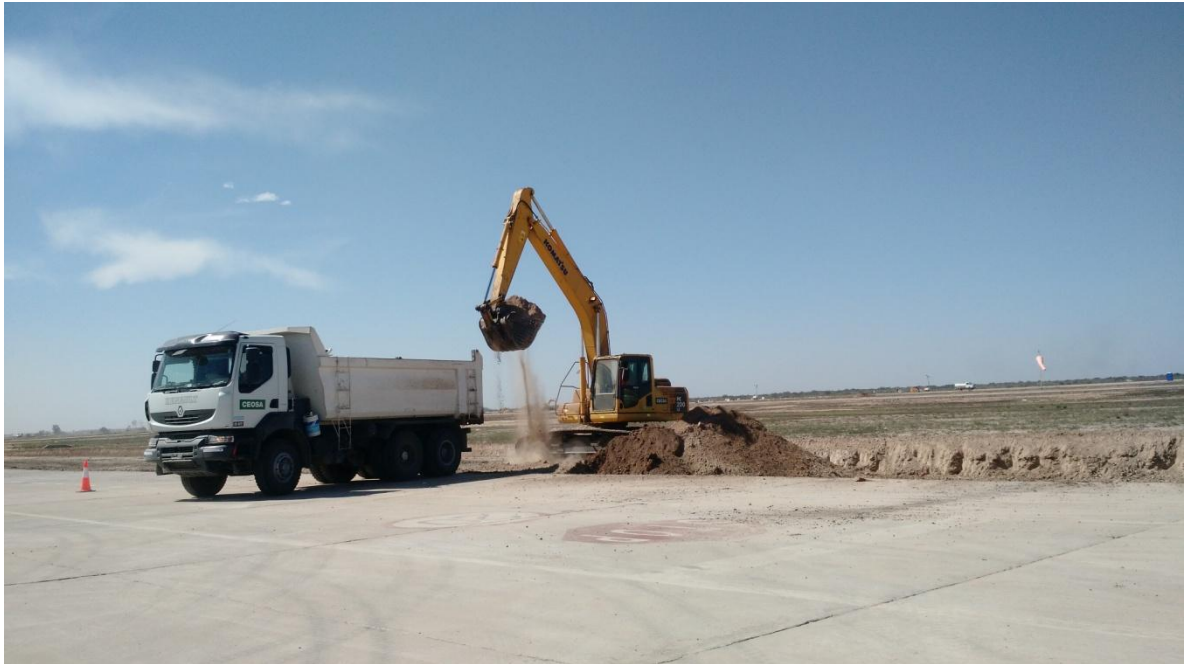
Figura N° 12: excavación para la subbase de asiento.