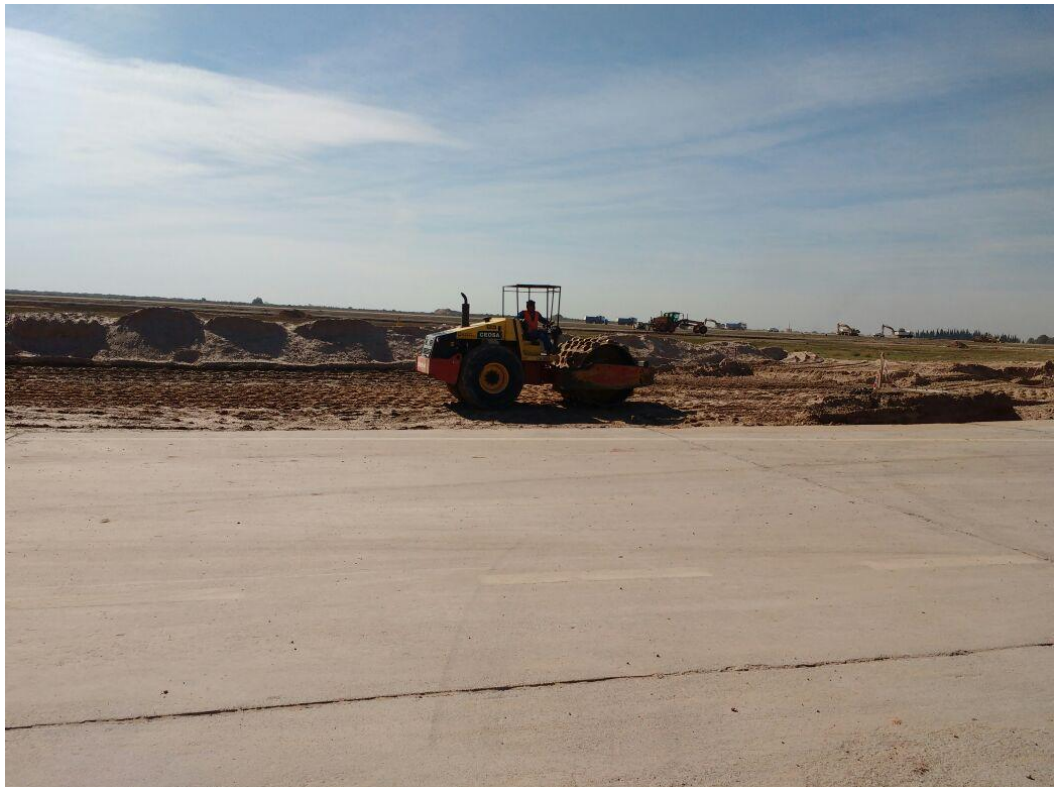
Figura N° 3: compactación de la base de asiento.