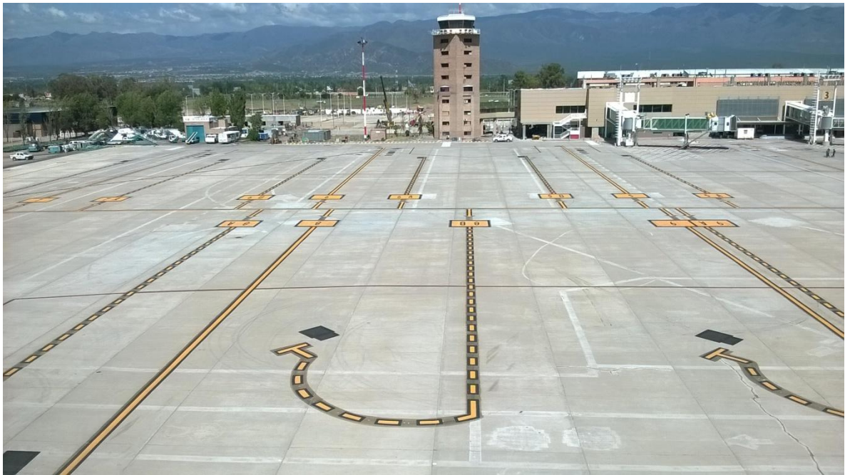
Figura N° 40: señalamiento diurno finalizado.