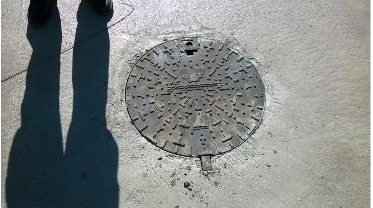
Figura N° 32: tapa de acceso de la cámara de inspección.