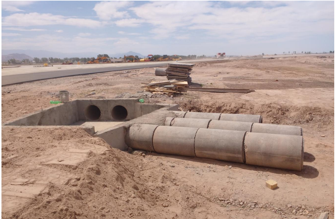
Figura N° 30: laterales y fondo de la cámara de inspección finalizada.