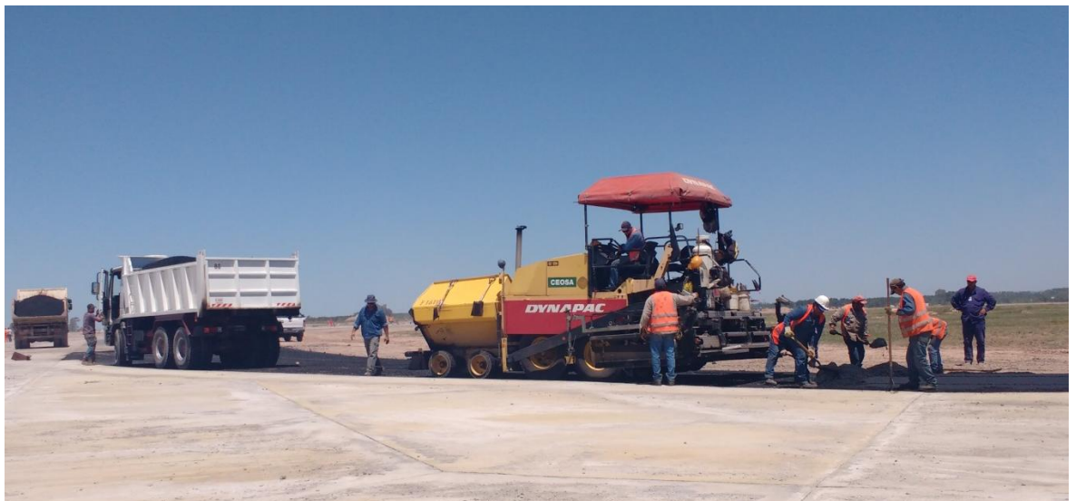
Figura N° 22: ejecución del pavimento asfáltico con terminadora.

Se controló la temperatura y se tomaron muestras del concreto asfáltico durante su colocación y luego se extrajeron testigos de todos los frentes de trabajo para el control de espesores y densidades, cumpliendo estos con las especificaciones de pliegos.