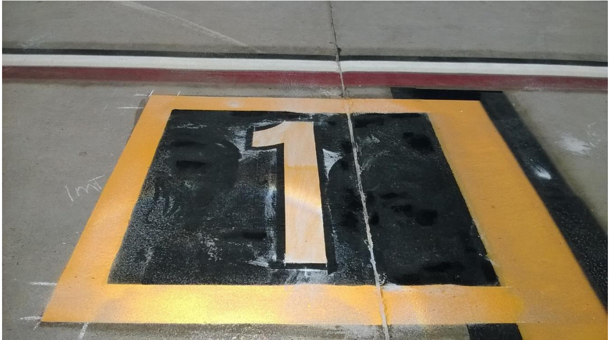
Figura N° 39: señalamiento diurno finalizado.