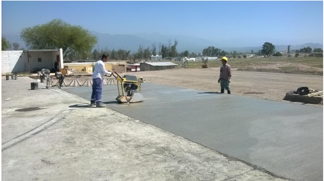
Figura N° 18: cajeo de juntas de contracción.