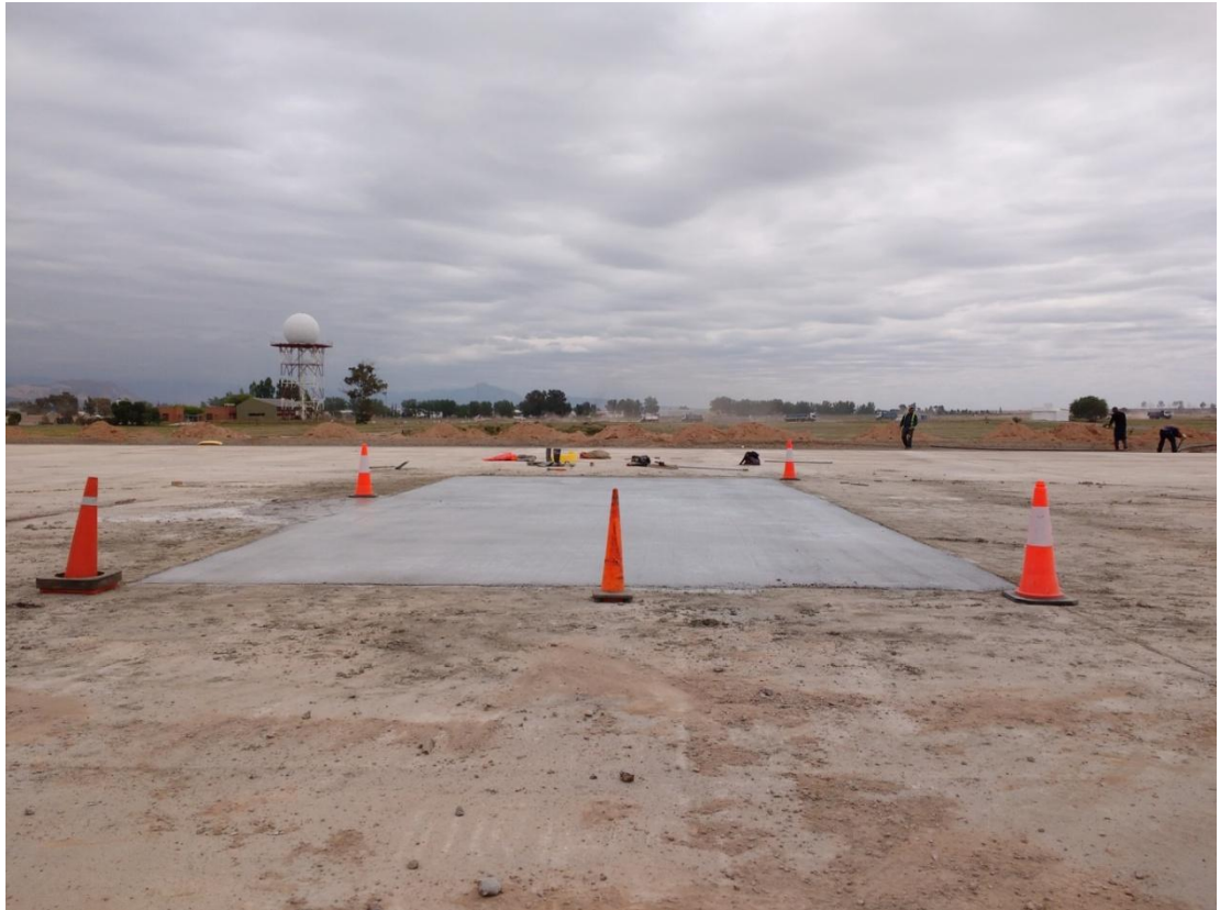
Figura N° 11: hormigonado de losa demolida por bacheo y de losa construida para ensanche.