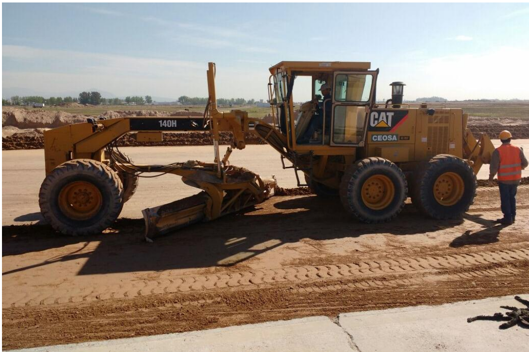
Figura N° 5: perfilado base de asiento.