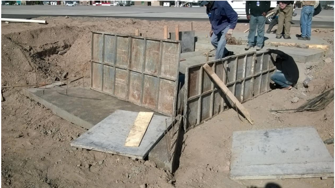
Figura N° 27: construcción de alcantarilla.

El presente ítem comprende la construcción de las cabeceras, alas y plateas de las nuevas alcantarillas de caño a ejecutar en los sectores indicados en planos y memorias de proyecto. La ejecución de estas tareas comenzó el 15 de noviembre (Figura N° 27) y finalizó el 19 del mismo mes (Figura N° 28).