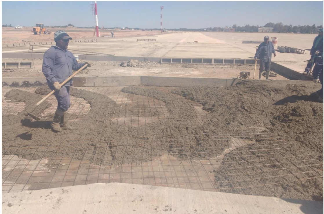
Figura N° 19: malla electrosoldada para losas irregulares.