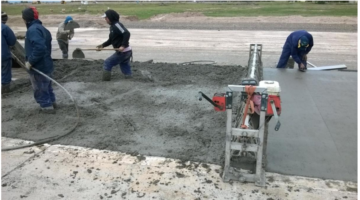
Figura N° 14: hormigonado de losas.