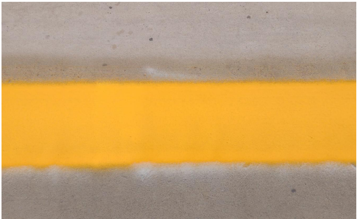
Figura N° 36: pintura y microesferas de vidrios.