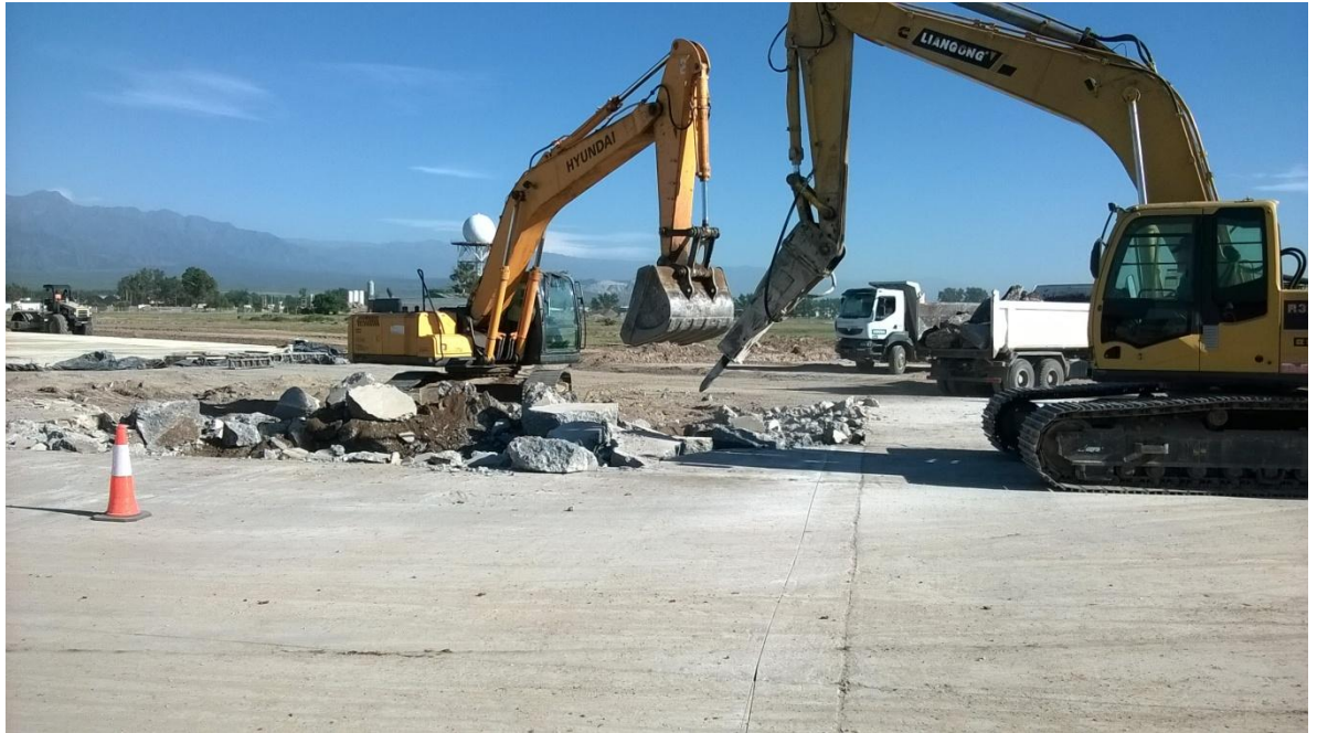
Figura N° 7: demolición de pavimento de hormigón con una retro excavadora con accesorio de martillo.