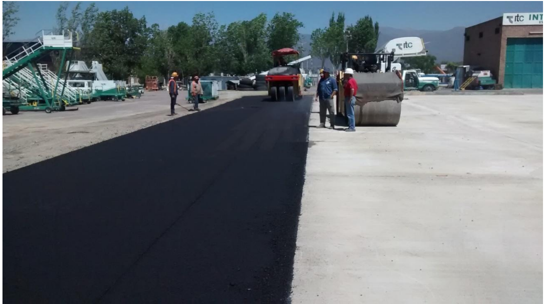
Figura N° 23: compactación con rodillo neumático.