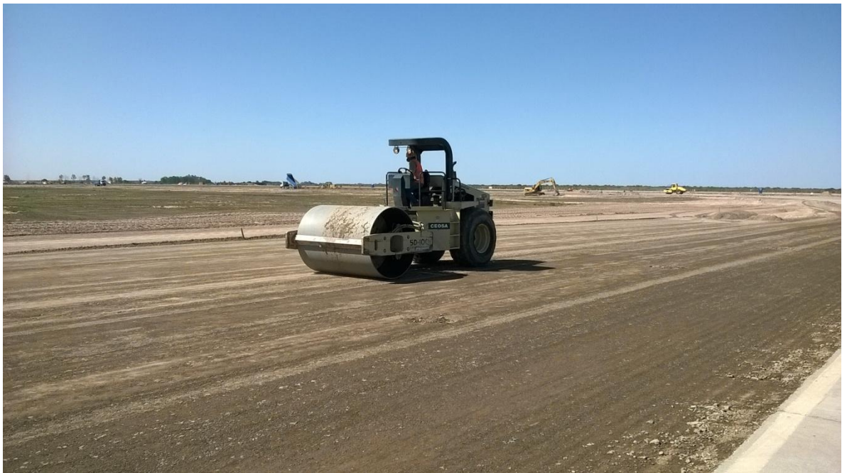
Figura N° 13: compactación de la subbase de asiento.