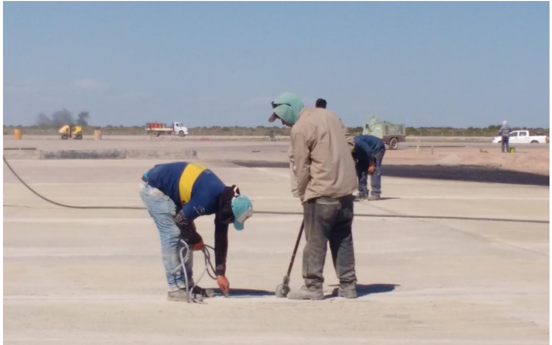
Figura N° 20: colocación de cordón de respaldo y silicona para sellado de juntas.