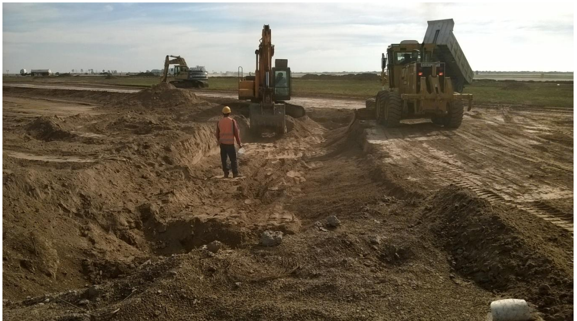
Figura N° 24: limpieza de zanjas.

El presente ítem comprende la limpieza y perfilado de zanjas y taludes resultantes de las tareas de movimiento de suelos (Figura N° 24).