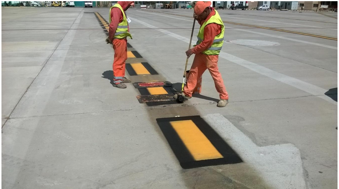
Figura N° 38: señalamiento diurno.