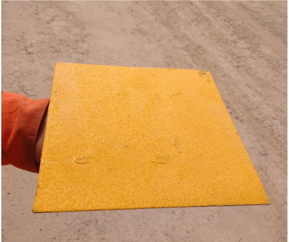
Figura N° 37: chapa para el control de espesores de la pintura.