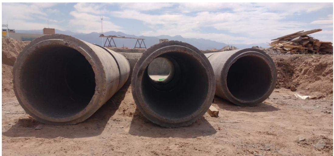
Figura N° 26: conductos de hormigón.