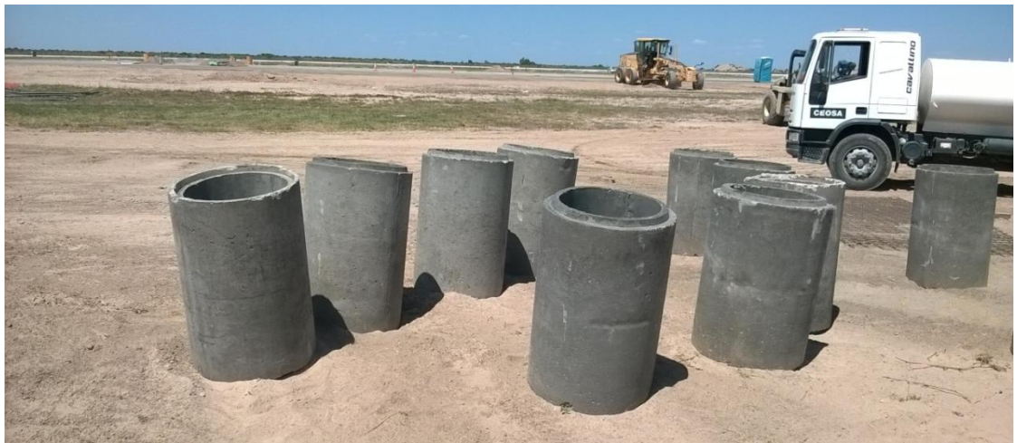
Figura N° 25: conductos de hormigón.

Se colocaron conductos de hormigón con diámetro interno 0.50 m y diámetro externo 0.60 m (Figura N° 25 y Figura N° 26).