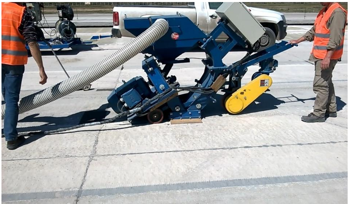
Figura N° 34: equipo para el borrado de pintura existente.