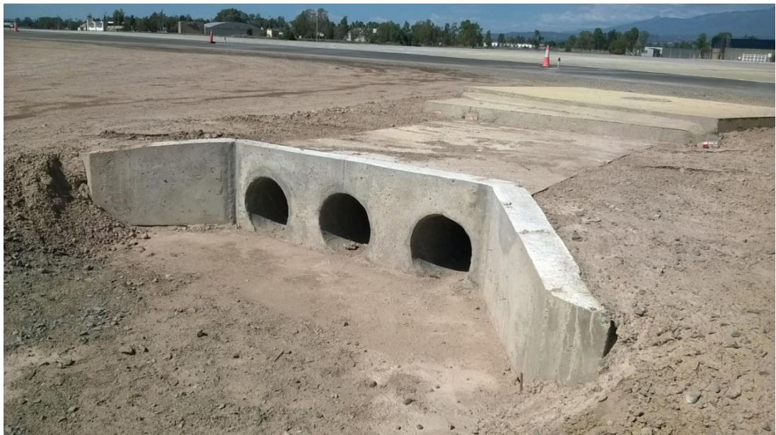
Figura N° 28: alcantarilla finalizada.