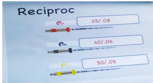
Fig.3- Sistema rotatorio RECIPROC

Se obturó con conos de gutapercha N°20 taper 0,6 calibrados a 25 en los conductos mesiales y en el conducto distal se utilizó conos N° 40 taper 0,4, (Día Dent Group International Inc. CANADA & USA). Una vez seleccionados los conos se llevó cemento sellador Sealapex (Sybron /Kerr. EE.UU) con lentulo (VDW, GmbH, München) calibre 25 y se realizó una obturación convencional mediante condensación lateral utilizando conos accesorios MF, F y FM (Día Dent Group International Inc. CANADÁ &USA). Por último se realizó obturación provisoria con Ionometro Vitreo para luego ser derivado a la Especialidad de Prótesis para la rehabilitación definitiva.