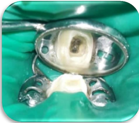
Fig.2– Aislamiento absoluto del elemento 47

Se aisló con goma dique (Dental dam- Sanctuary) (Fig.2), se retiró el material de obturación provisoria con fresa redonda F: G N. 4. Dentro de la cámara se encontró una torunda de algodón .Para retirar la gutapercha de los canales radiculares se usaron fresas de GatesN°1 y 2 (Dentstply-Maillefer, Suiza) en el tercio coronal, luego se procedió a la instrumentación mecanizada de los conductos con sistema rotatorio RECIPROC® BLUE (VDW, Múnich, Alemania)(Fig.3) con limas #25/.08 los conductos mesiales y con lima #40/.06 el conducto distal, se determinó la longitud de trabajo con localizador apical T-Root VI (Foshan Tris Dental Instrument Co., Ltd,China) las cuales fueron determinadas en 20,5 mm el conducto de la raíz distal y 19 mm en los conductos MV-ML de la raíz mesial.