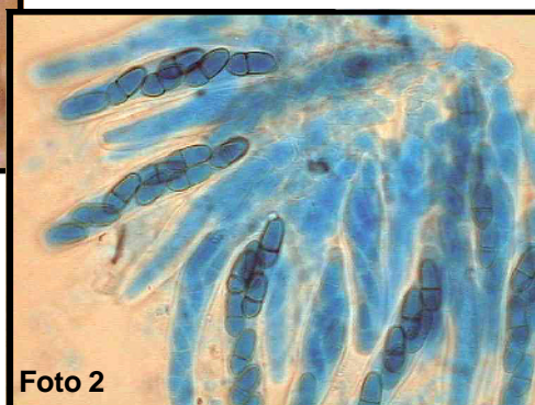
Ascosporas con sus ascosporas bicelulares (fotografía al microscopio óptico, 1000 x).