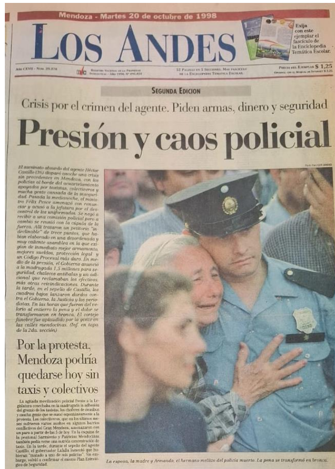
Fuente: Diario Los Andes, 20 de octubre de 1998. Ejemplar consultado en la Hemeroteca de la Biblioteca General San Martín.